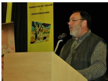
Le président Ernest Weber ouvre une nouvelle session de formation de base