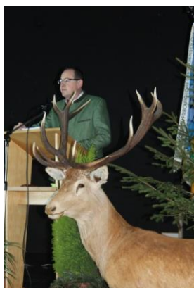
Le « nouveau » président d'honneur